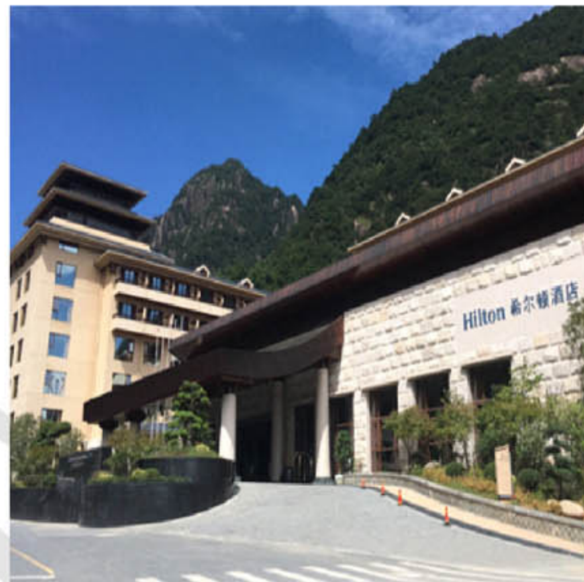
▲三清山希尔顿度假酒店