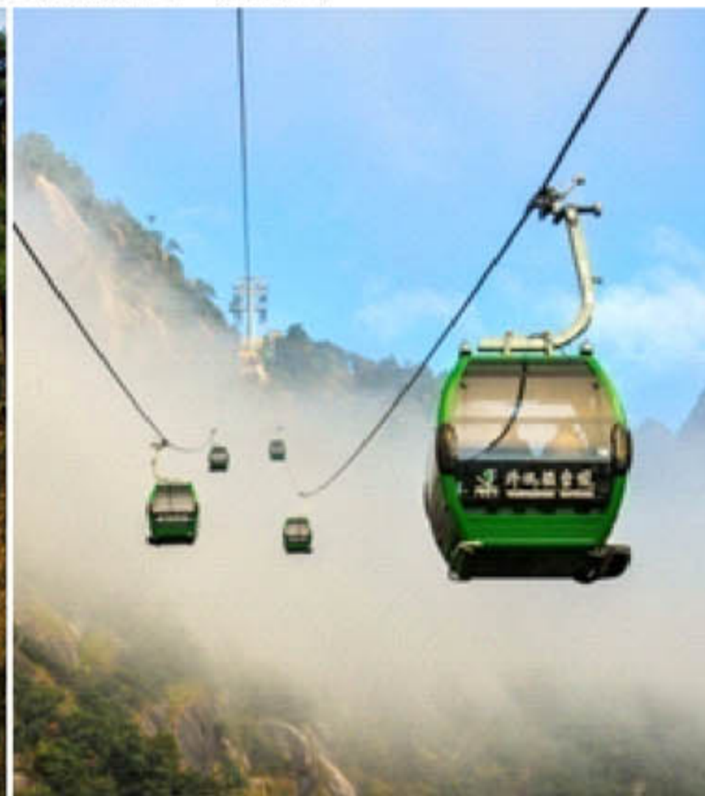
▲穿行于三清山美景中的索道