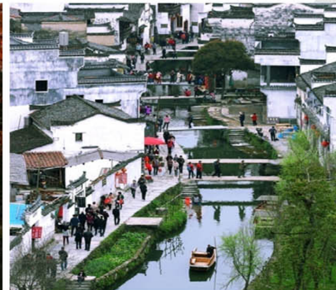
▲中国最美乡村——婺源