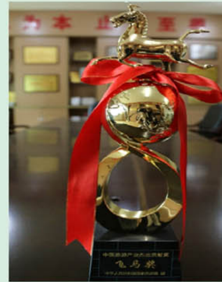
三清集团荣获2017年第三届 中国旅游产业杰出贡献奖“飞马奖”

SQMTG 三清集团 主办：江西三清山旅游集团有限公司 2017年8月20日 第4期 总160期 网址：www.sqsljt.com E-mail: 476558334@qq.com 网络实名：三清山旅游集团