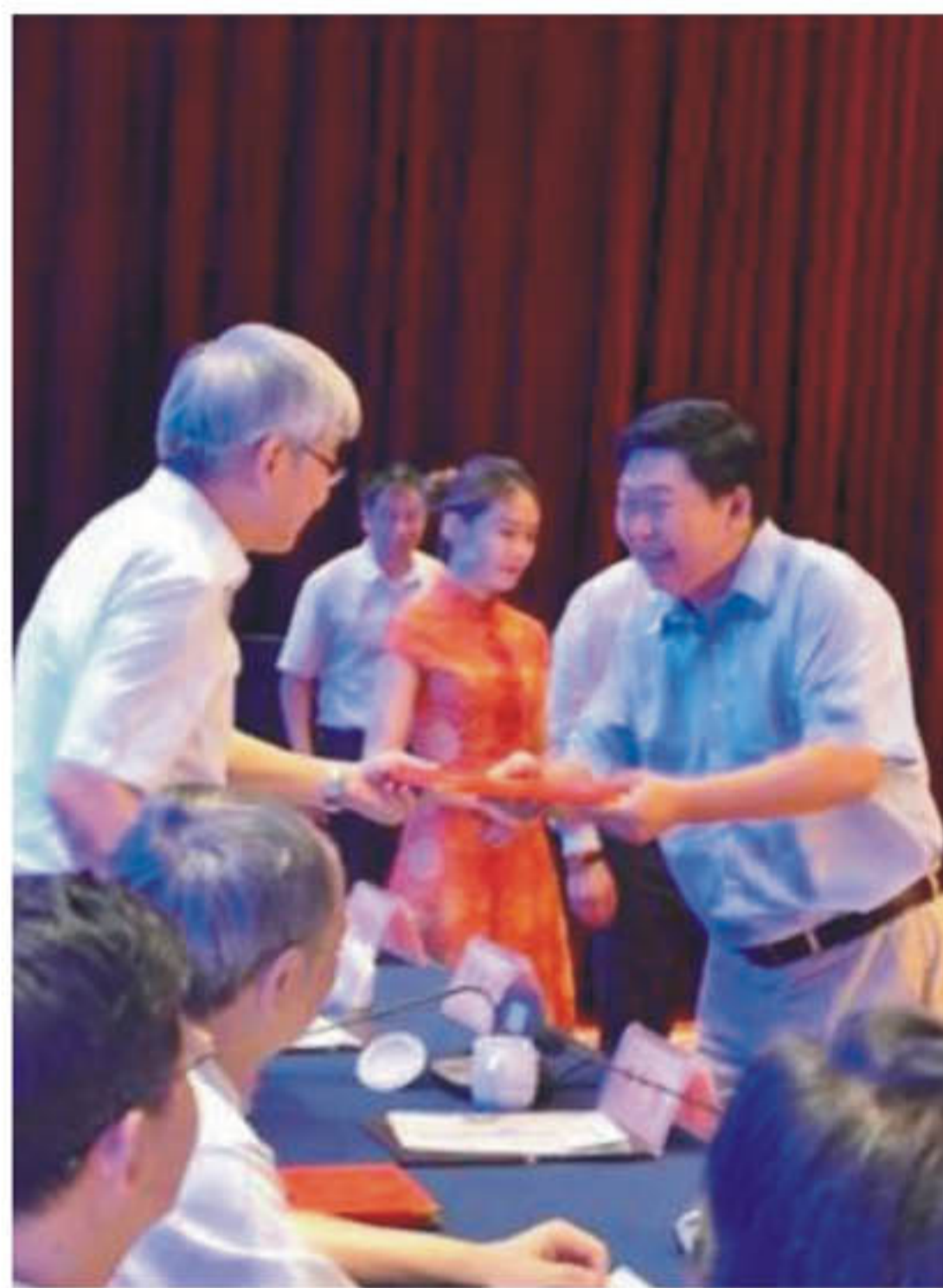
▲副省长李贻煌为三清集团颁发“2016江西经济十件大事功勋企业”荣誉证书