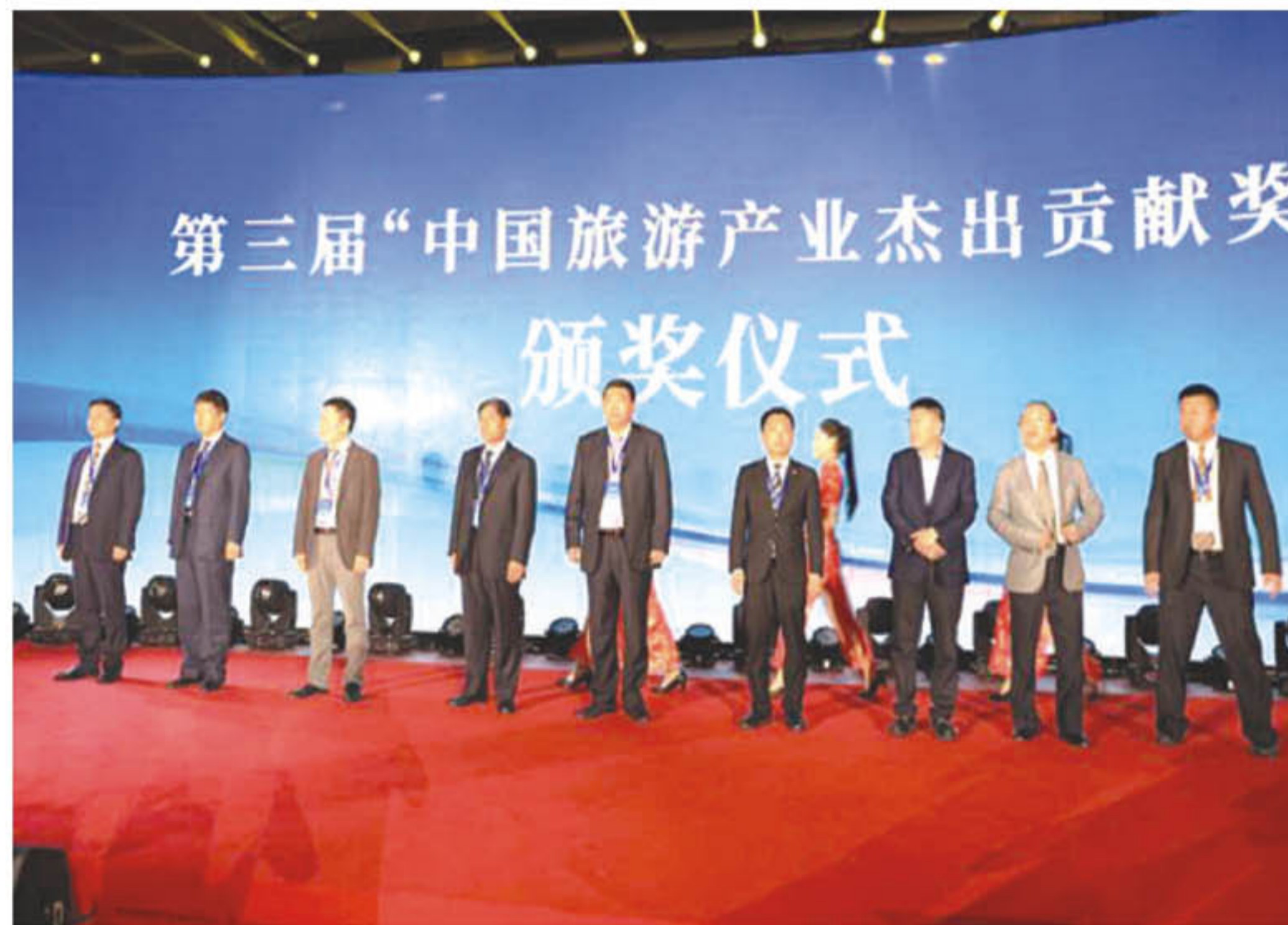
▲飞马奖颁奖仪式现场

如江岭景区万亩梯田花海已成为全国摄影爱好者的天堂，是全国春季赏花旅游的风向标，被誉为“中国四大花海之一”。逐步打造为四季皆宜的具有浓郁乡土意象的综合性乡村型山地主题休闲度假区。李坑景区除作为江南典型的“小桥流水人家”，还将延伸为集旅游观光、休闲、娱乐、购物于一体的“文旅商”综合体，引领婺源发展全域旅游的标杆。卧龙谷景区具备独特的山水文化和花岗岩峡谷景观以及优良的大气和水环境，与婺源其他旅游产品具有很强的差异化和互补性，能有效弥补婺源夏季旅游产品空白。严田景区除拥有秀美的田园风光，也是婺源唯一保存完好的古村落水口文化遗址，文化品位厚重。