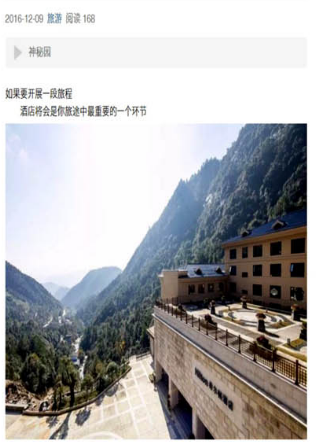
选择一家好的酒店，才能有精彩后的体验